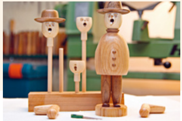
Er pafft friedlich vor sich hin: Der Räuchermann aus dem Erzgebirge. Der beliebte Stubengenosse lässt sich Schritt für Schritt dreheln. Und zwar ab Seite 34