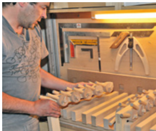
Gemacht für Ihre Furnierarbeiten: Mit der Presse zum Selbstbau bringen Sie kräftig Druck in Ihre Projekte. Seite 14