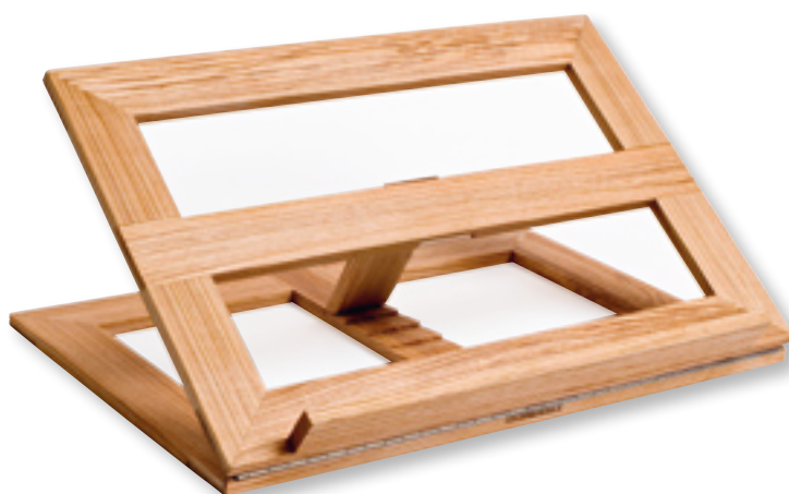
Schont die Kochbücher und die Nerven: Der praktische Buchständer lässt sich vielseitig einsetzen und ist nicht zu schwer zu bauen. Seite 60