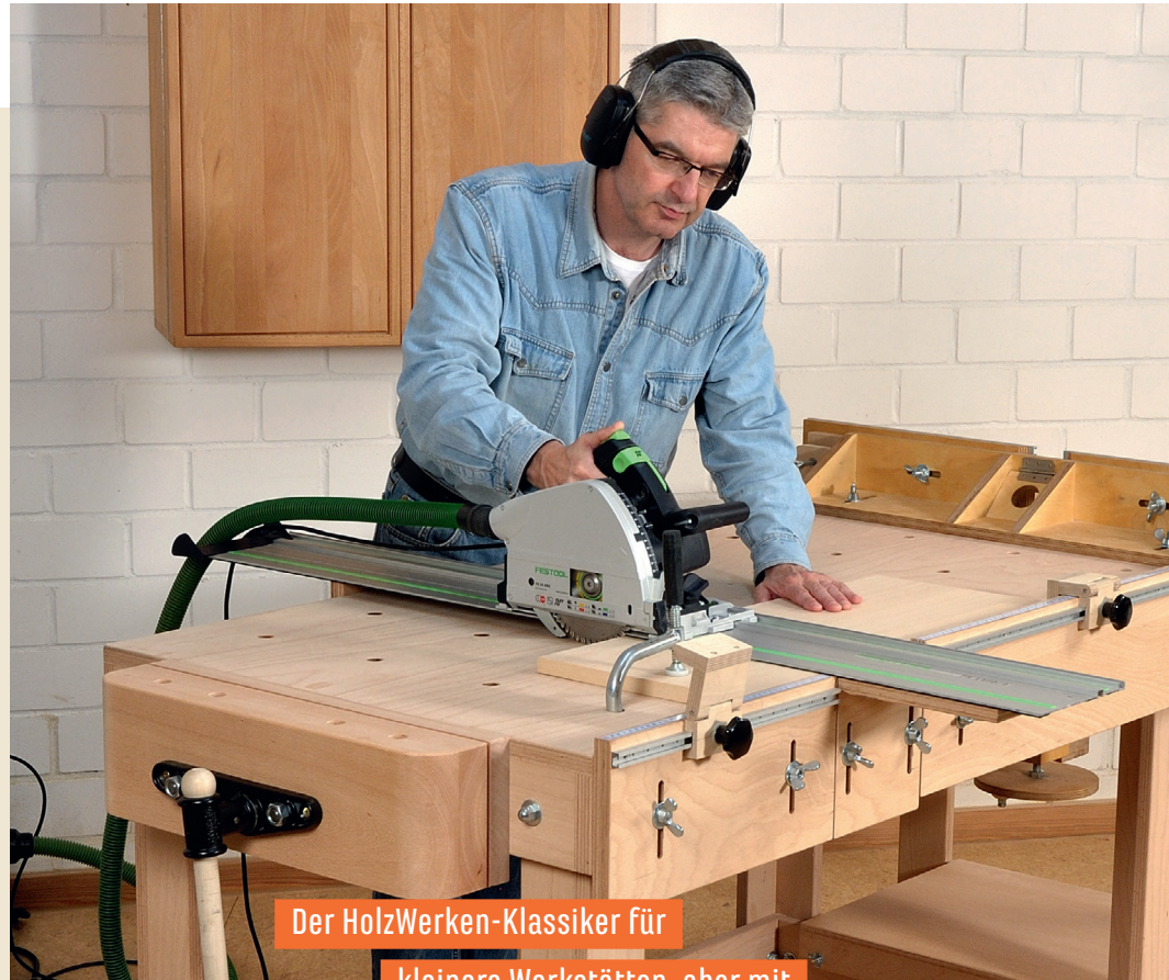
Der HolzWerken-Klassiker für kleinere Werkstätten, aber mit voller Funktion: Bauplan und komplette Anleitung für eine neue, vollwertige Multi-Werkbank