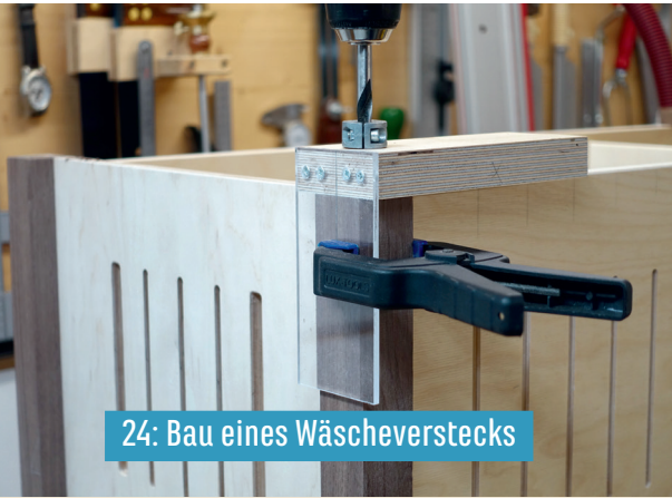
24: Bau eines Wäscheverstecks