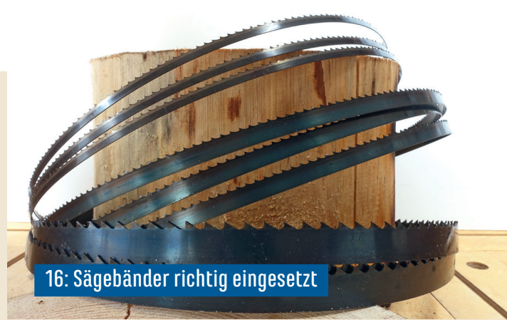
16: Sägebänder richtig eingesetzt