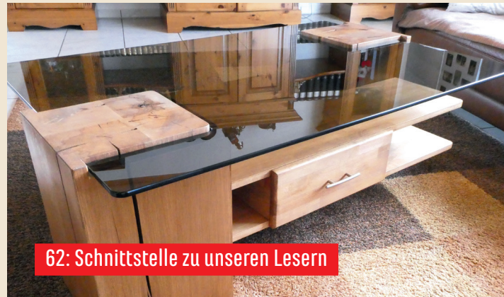
62: Schnittstelle zu unseren Lesern