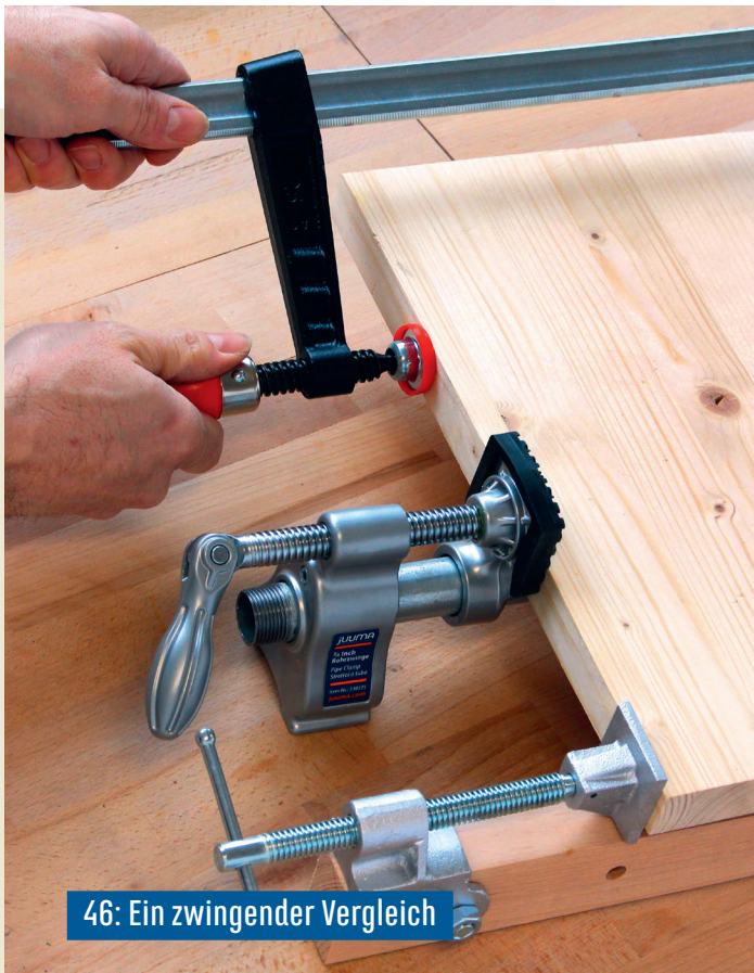
46: Ein zwingender Vergleich