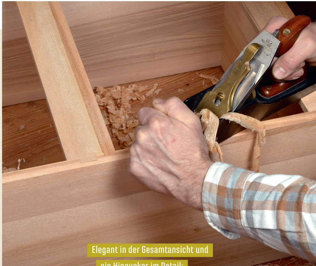
Elegant in der Gesamtansicht und ein Hingucker im Detail: