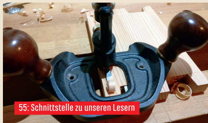
55: Schnittstelle zu unseren Lesern