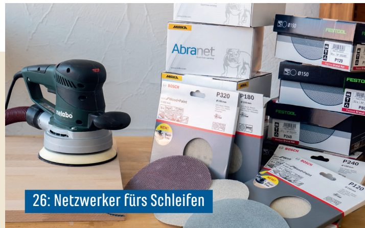
26: Netzwerker fürs Schleifen