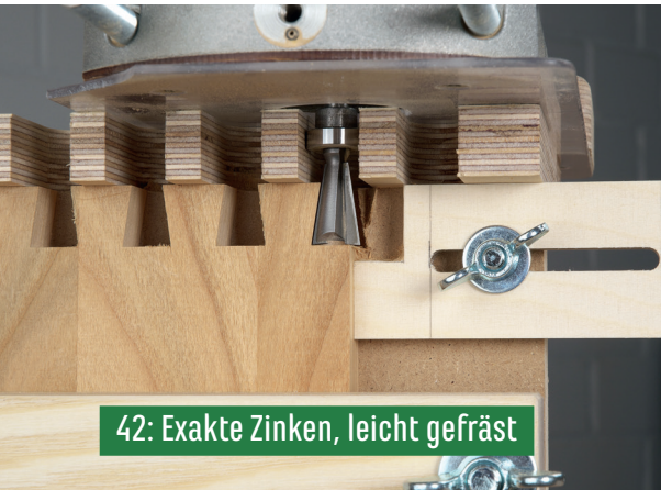
42: Exakte Zinken, leicht gefräst