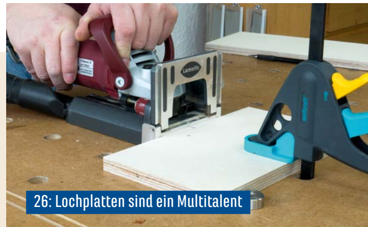
26: Lochplatten sind ein Multitalent