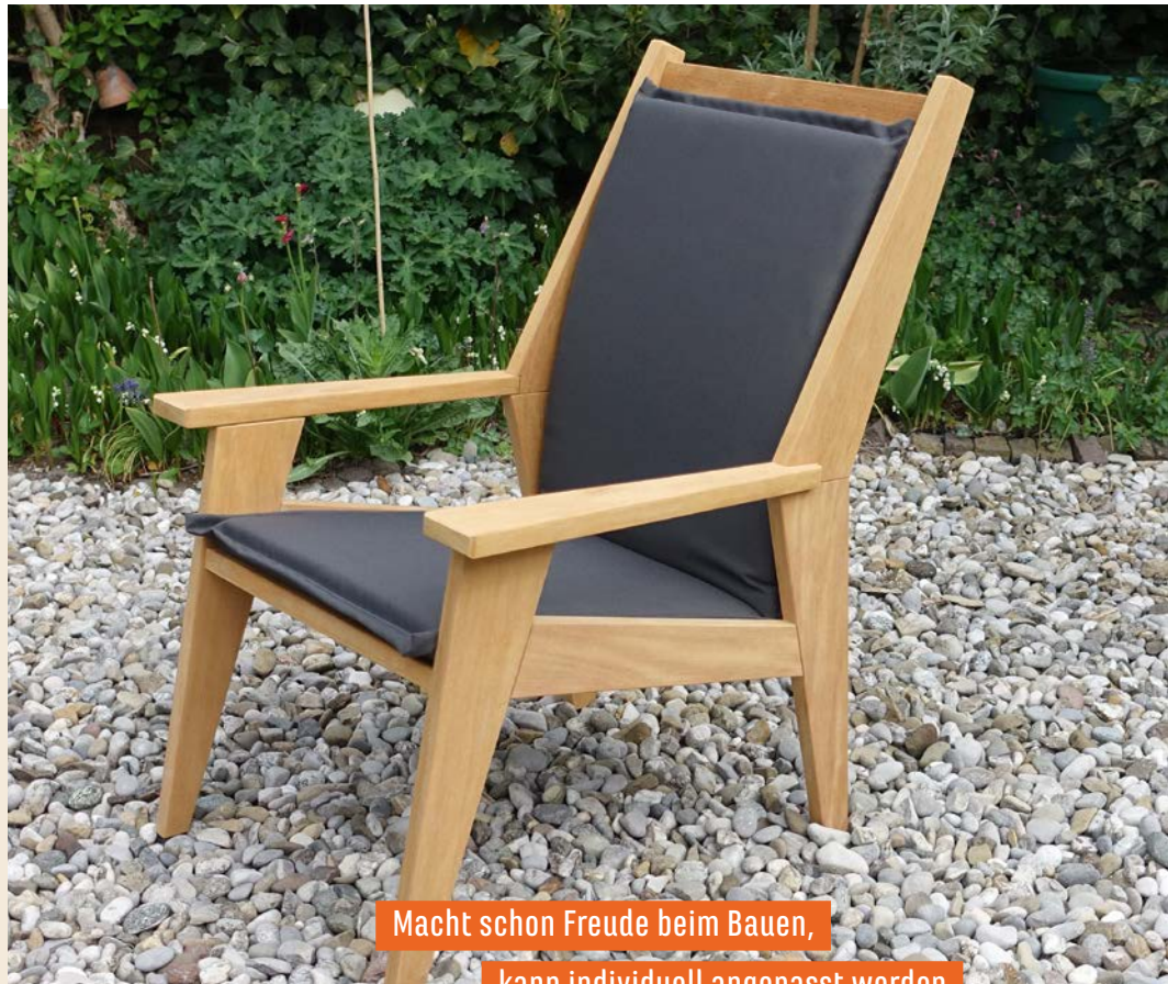
Macht schon Freude beim Bauen, kann individuell angepasst werden und ist ein bequemer Hingucker: