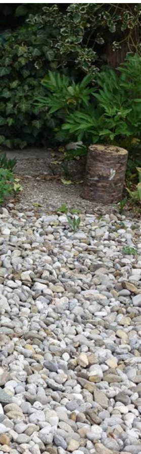
44: Schmuckstück statt Feuerholz