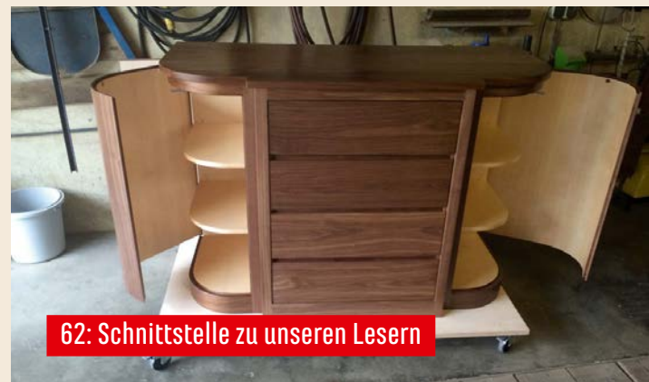
62: Schnittstelle zu unseren Lesern