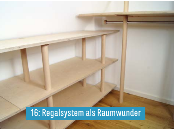
16: Regalsystem als Raumwunder