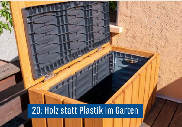
20: Holz statt Plastik im Garten