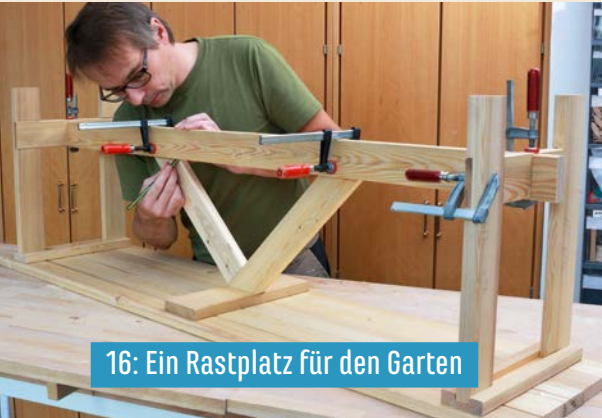
16: Ein Rastplatz für den Garten