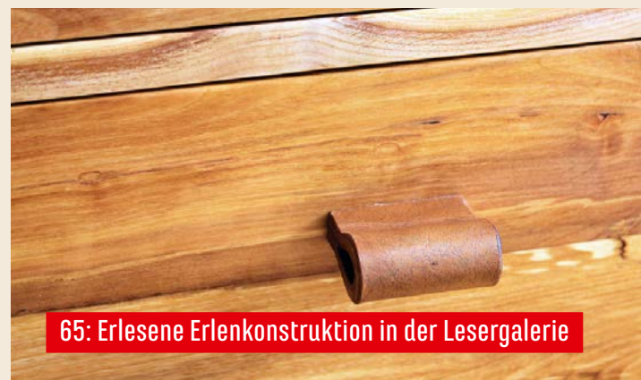
65: Erlesene Erlenkonstruktion in der Lesergalerie