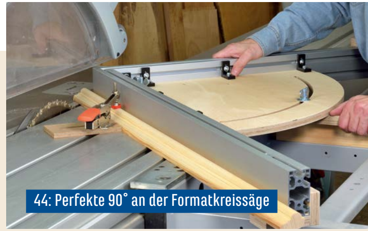
44: Perfekte 90° an der Formatkreissäge