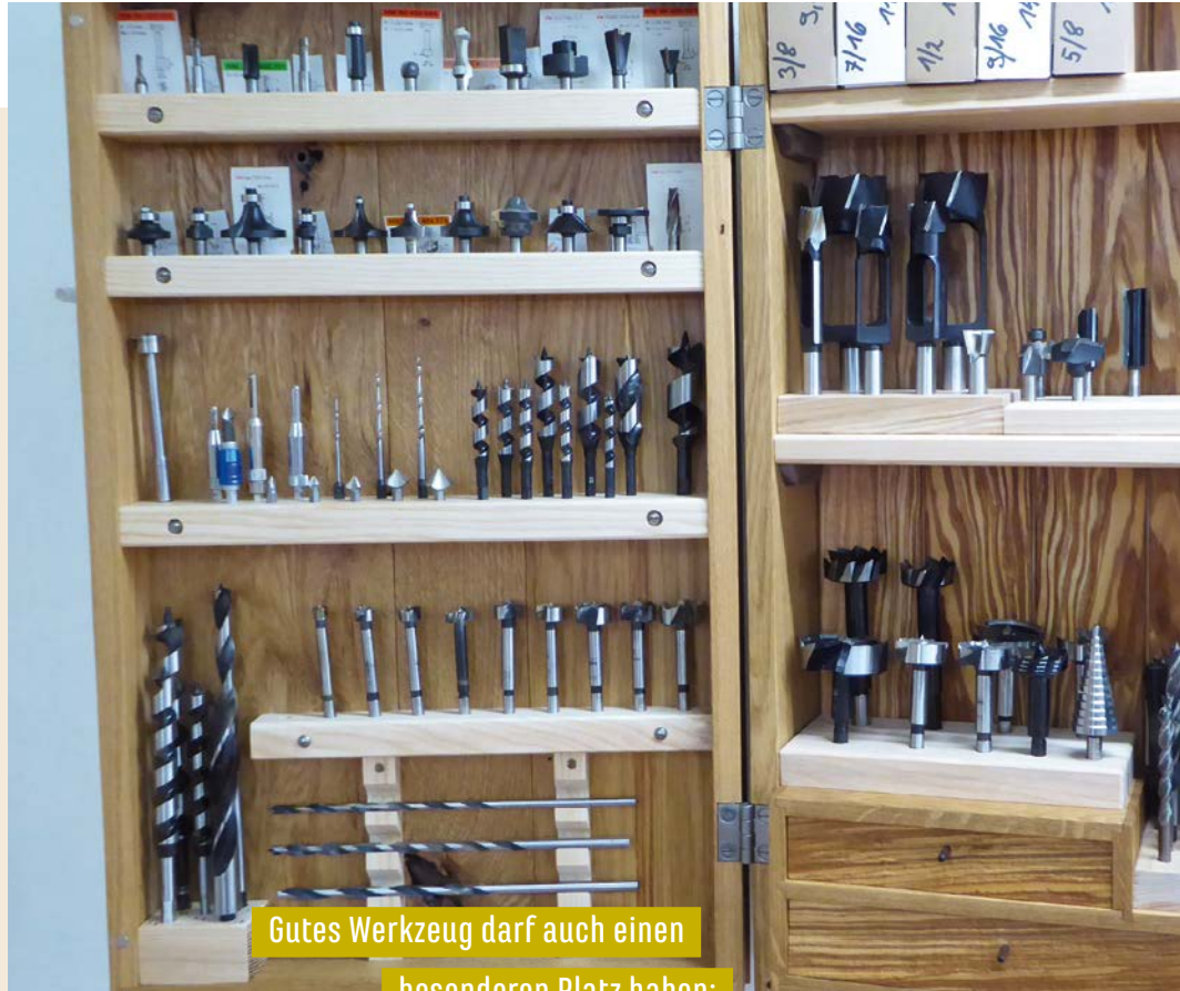
Gutes Werkzeug darf auch einen besonderen Platz haben:

Dieser Bohrschrank besticht nicht nur durch