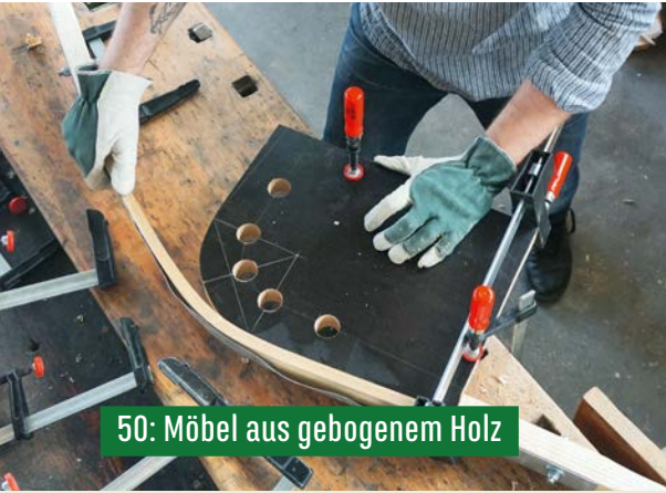
50: Möbel aus gebogenem Holz