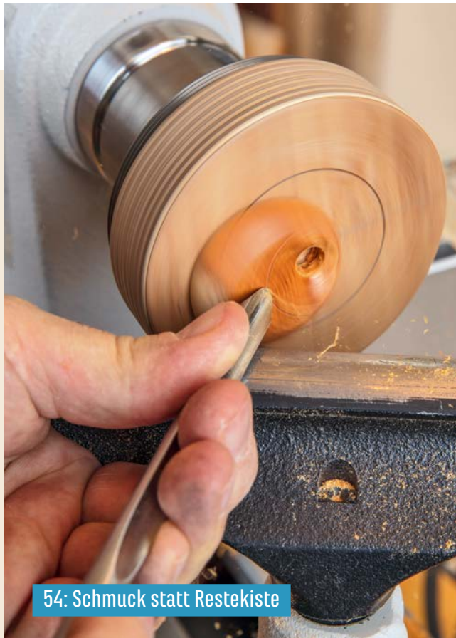
54: Schmuck statt Restekiste