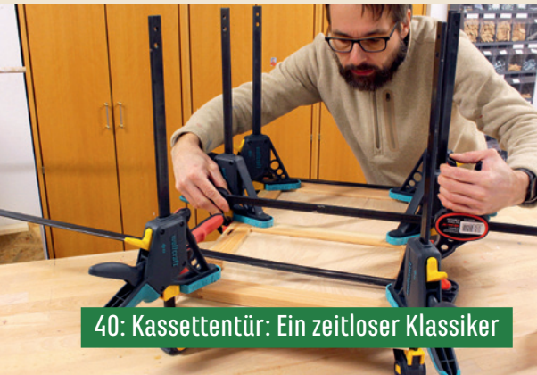
40: Kassettenür: Ein zeitloser Klassiker