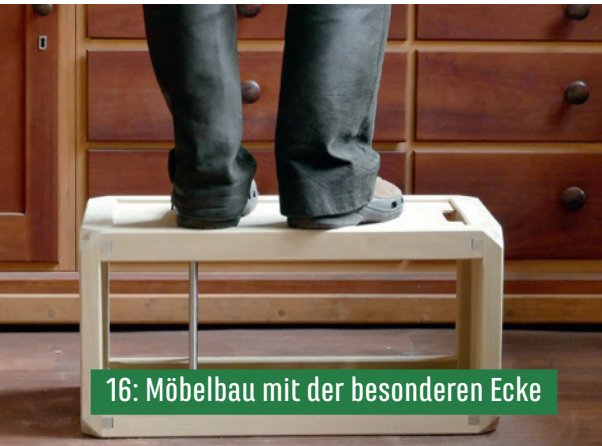
16: Möbelbau mit der besonderen Ecke