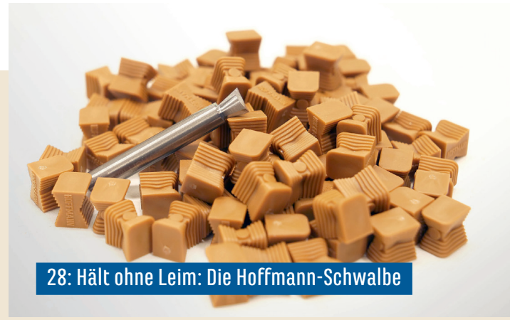
28: Hält ohne Leim: Die Hoffmann-Schwalbe