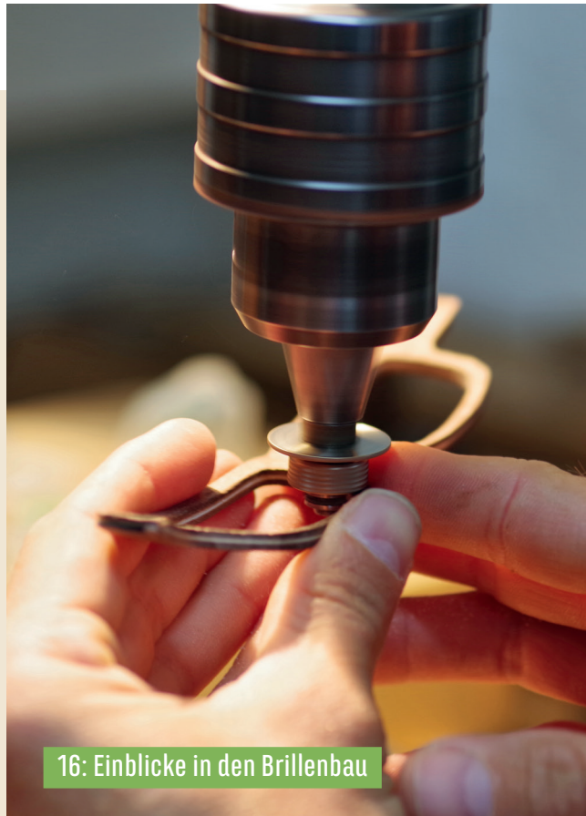
16: Einblicke in den Brillenbau