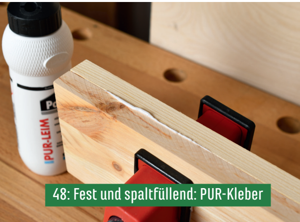
48: Fest und spaltfüllend: PUR-Kleber