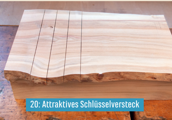
20: Attraktives Schlüsselversteck