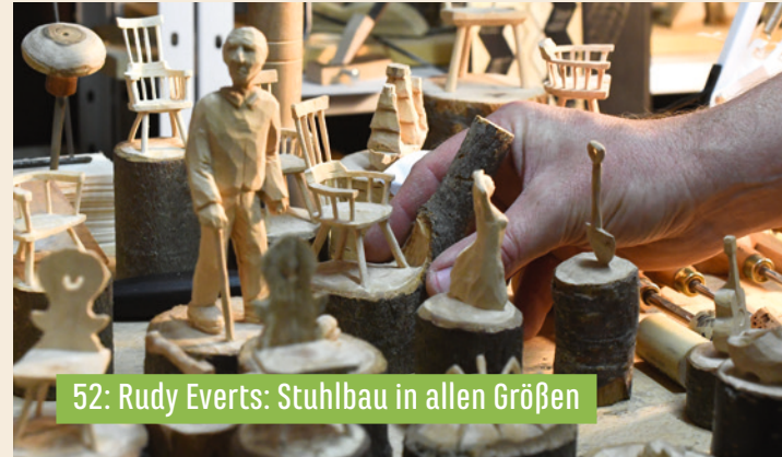
52: Rudy Everts: Stuhlbau in allen Größen