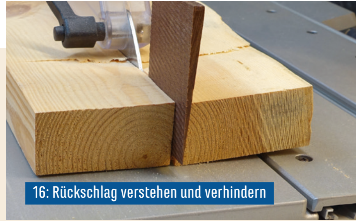
16: Rückschlag verstehen und verhindern