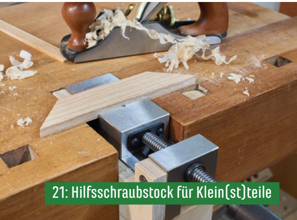
21: Hilfsschraubstock für Klein(st)teile