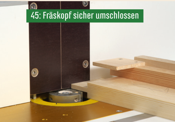
45: Fräskopf sicher umschlossen