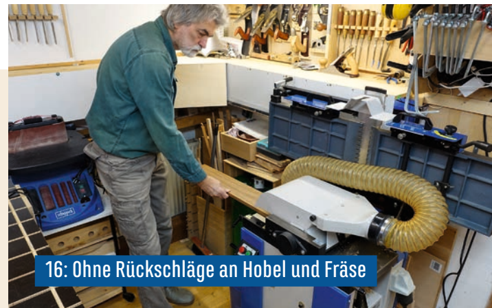
16: Ohne Rückschläge an Hobel und Fräse