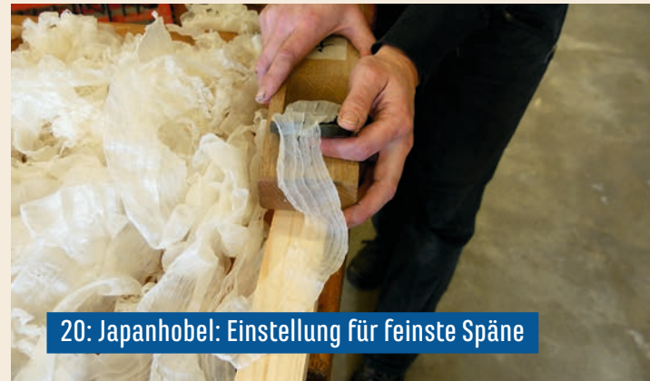
20: Japanhobel: Einstellung für feinste Späne