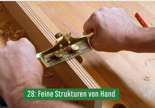
28: Feine Strukturen von Hand