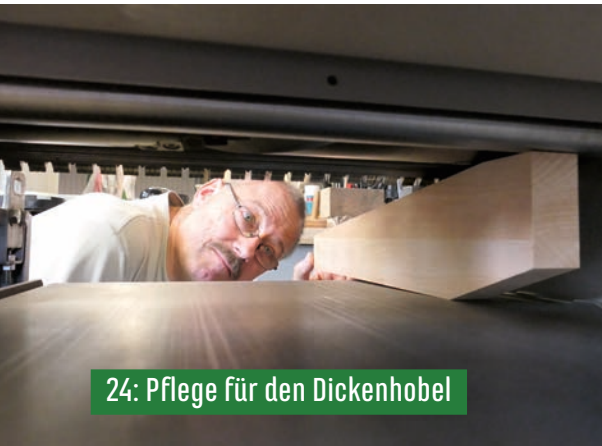
24: Pflege für den Dickenhobel