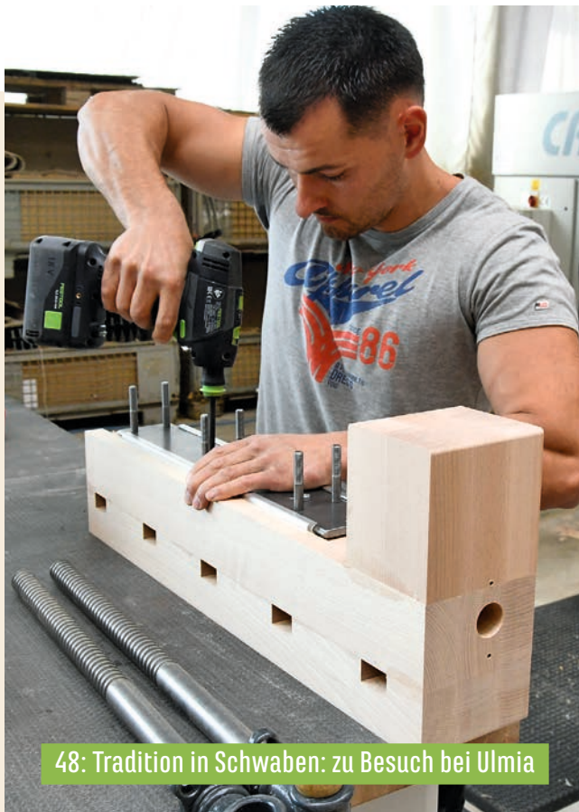
48: Tradition in Schwaben: zu Besuch bei Ulmia