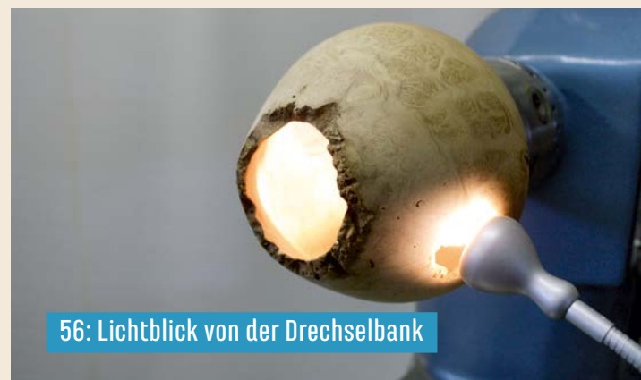
56: Lichtblick von der Drechselbank