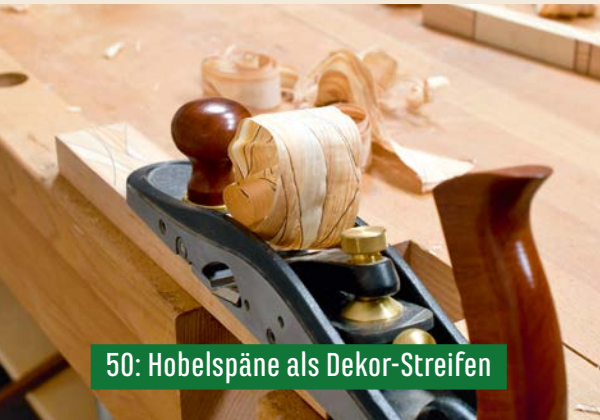
50: Hobelspäne als Dekor-Streifen