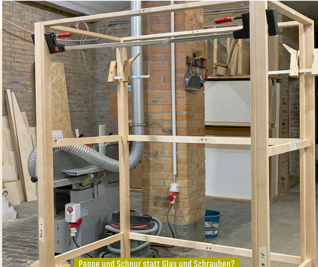
Pappe und Schnur statt Glas und Schrauben?

Dieser Kleiderschrank bringt viele neue Materialien auf Ihre Werkbank