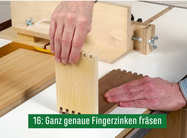
16: Ganz genaue Fingerzinken fräsen