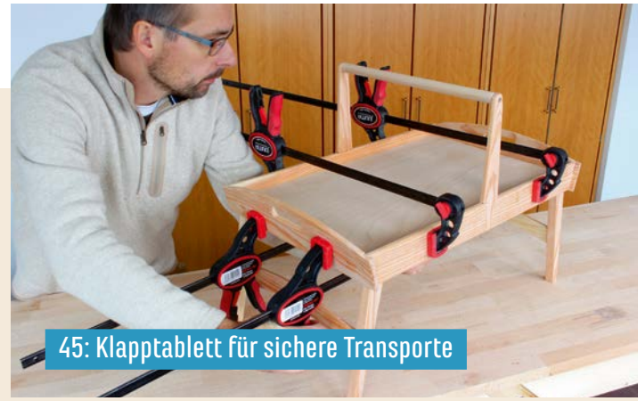
45: Klapptablett für sichere Transporte