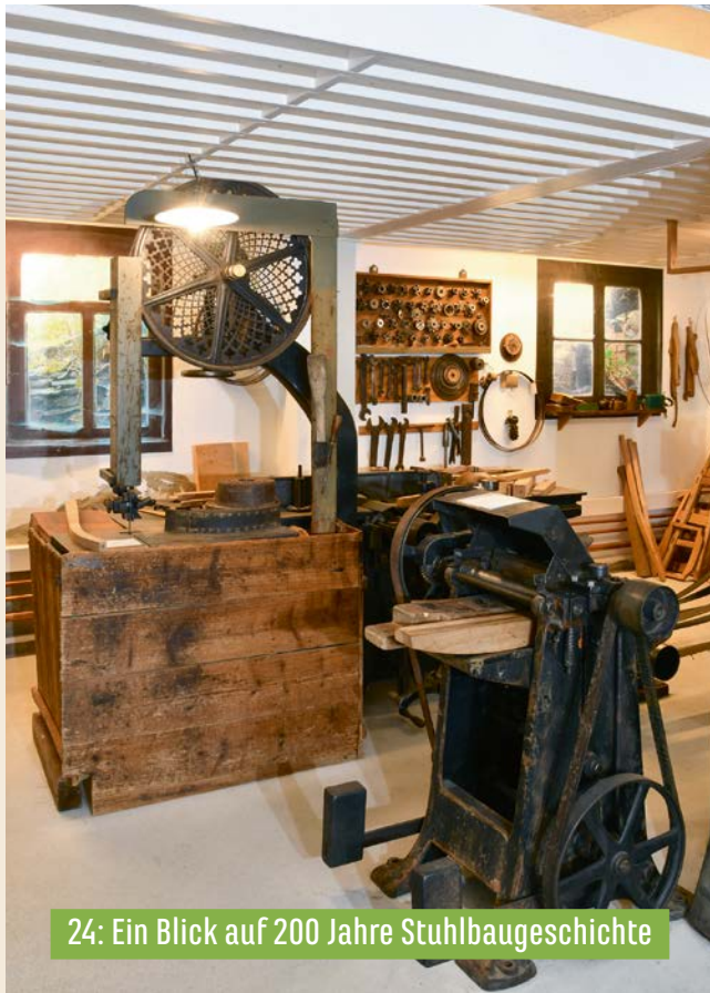
24: Ein Blick auf 200 Jahre Stuhlbaugeschichte