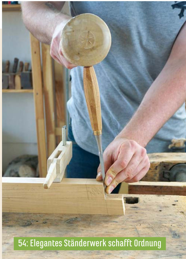
54: Elegantes Ständerwerk schafft Ordnung