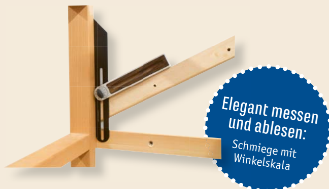
Elegant messen und ablesen: Schmiege mit Winkelskala