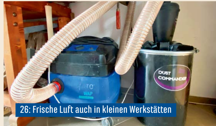
26: Frische Luft auch in kleinen Werkstätten