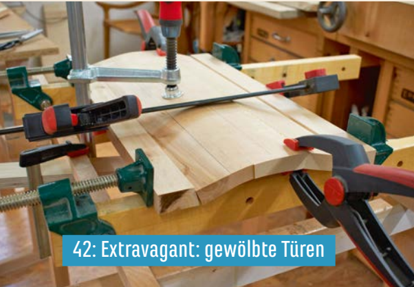
42: Extravagant: gewölbte Türen