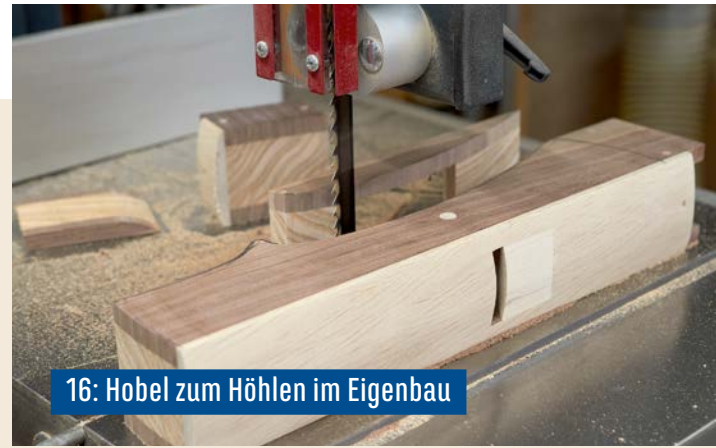
16: Hobel zum Höhlen im Eigenbau