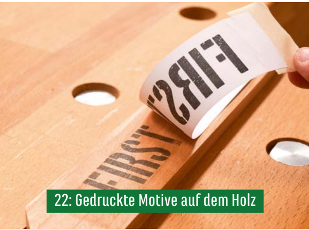
22: Gedruckte Motive auf dem Holz