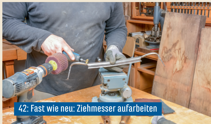
42: Fast wie neu: Ziehmesser aufarbeiten