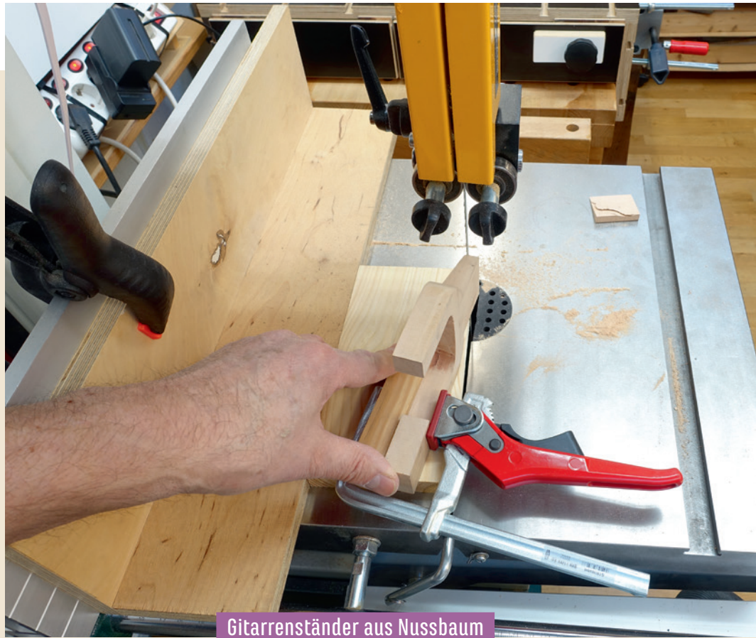
Gitarrenständer aus Nussbaum