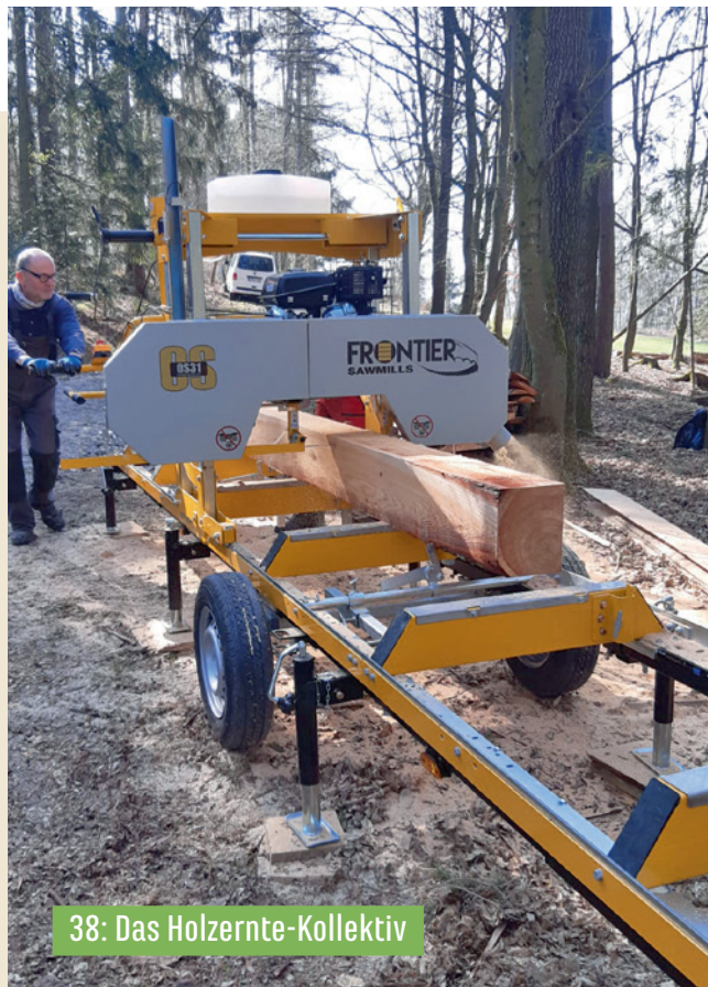
38: Das Holzernte-Kollektiv