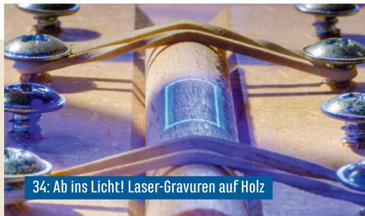
34: Ab ins Licht! Laser-Gravuren auf Holz