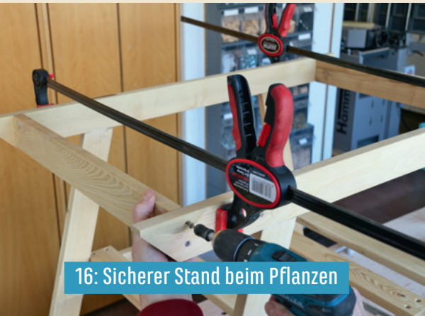
16: Sicherer Stand beim Pflanzen