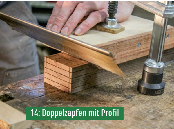
14: Doppelzapfen mit Profil