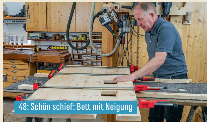
48: Schön schief: Bett mit Neigung