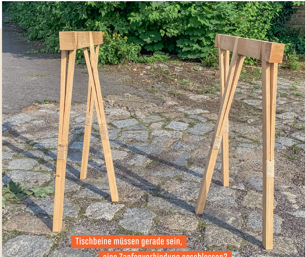
Tischbeine müssen gerade sein, eine Zapfenverbindung geschlossen?

Unsere extravagante Lösung straft diese Standards Lügen.