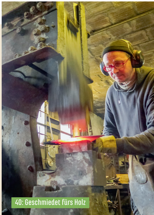
40: Geschmiedet fürs Holz