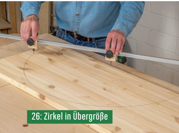
26: Zirkel in Übergröße