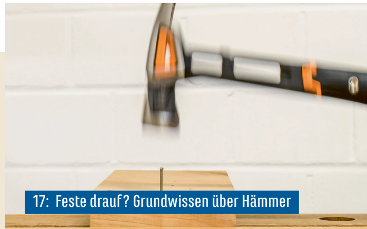
17: Feste drauf? Grundwissen über Hämmer