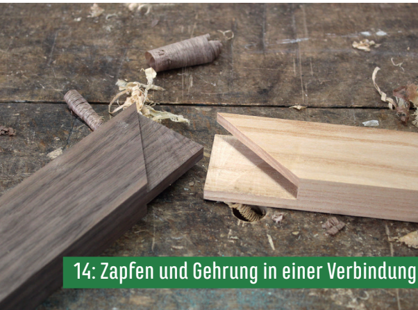
14: Zapfen und Gehrung in einer Verbindung