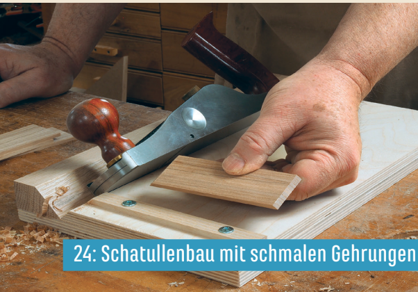
24: Schatullenbau mit schmalen Gehrungen