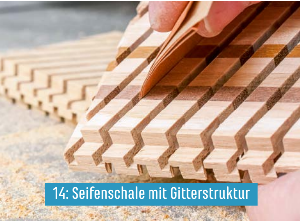
14: Seifenschale mit Gitterstruktur