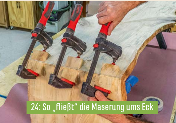
24: So „fließt“ die Maserung ums Eck