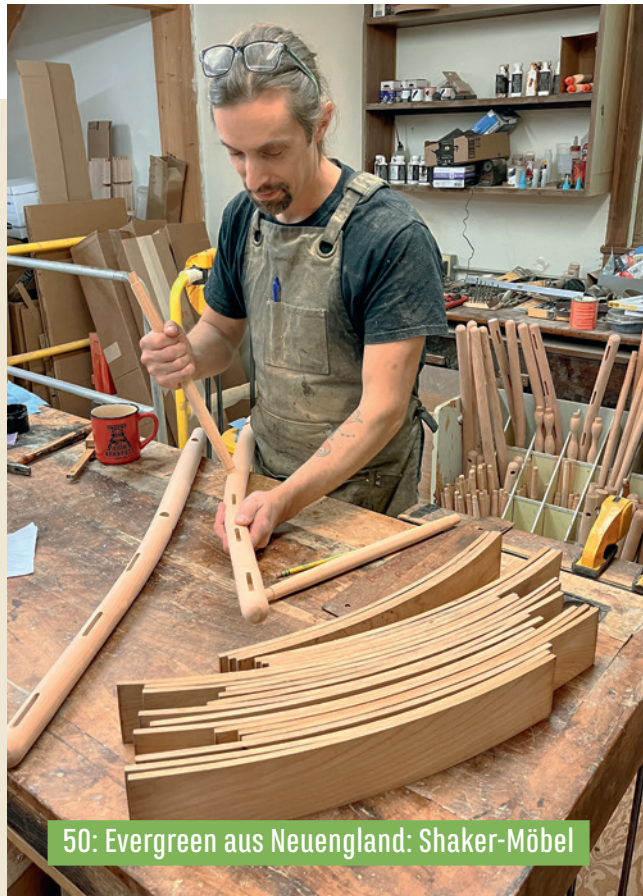
50: Evergreen aus Neuengland: Shaker-Möbel