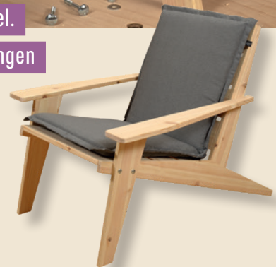
Hier ersetzen clevere Vorrichtungen den großen Maschinenpark!