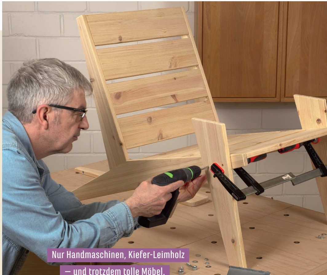
Nur Handmaschinen, Kiefer-Leimholz – und trotzdem tolle Möbel.