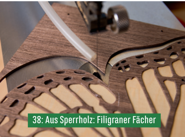
38: Aus Sperrholz: Filigraner Fächer