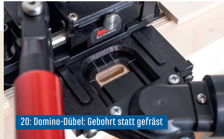
20: Domino-Dübel: Gebohrt statt gefräst