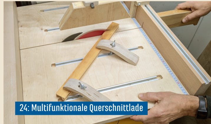
24: Multifunktionale Querschnittlade