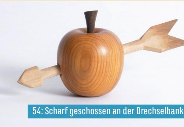
54: Scharf geschossen an der Drechselbank