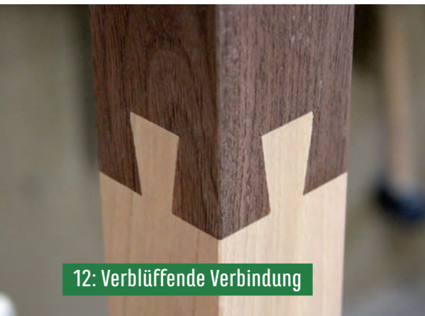
12: Verblüffende Verbindung