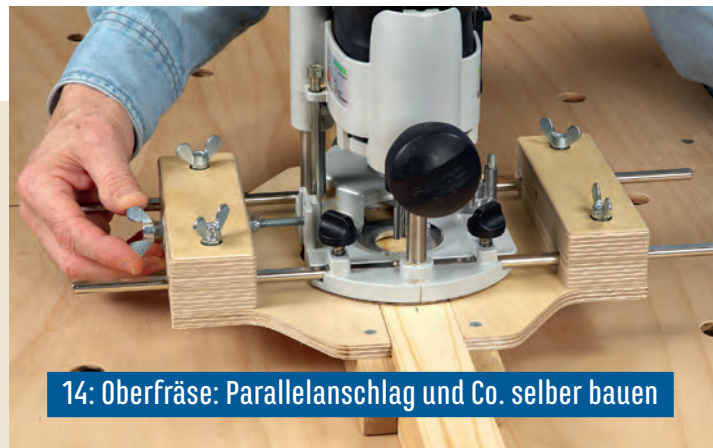
14: Oberfräse: Parallelanschlag und Co. selber bauen