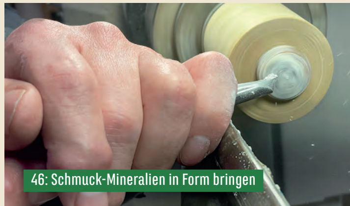
46: Schmuck-Mineralien in Form bringen