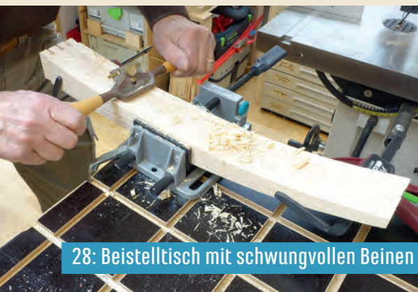
28: Beistelltisch mit schwungvollen Beinen