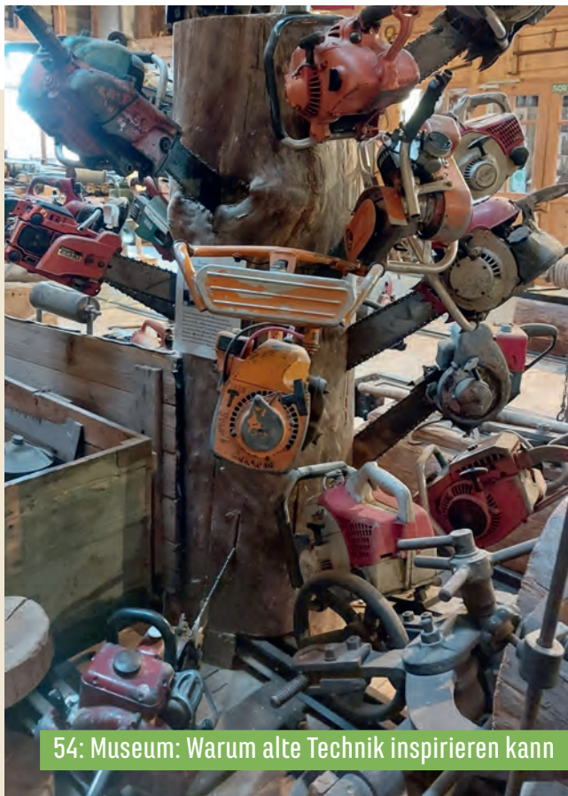
54: Museum: Warum alte Technik inspirieren kann